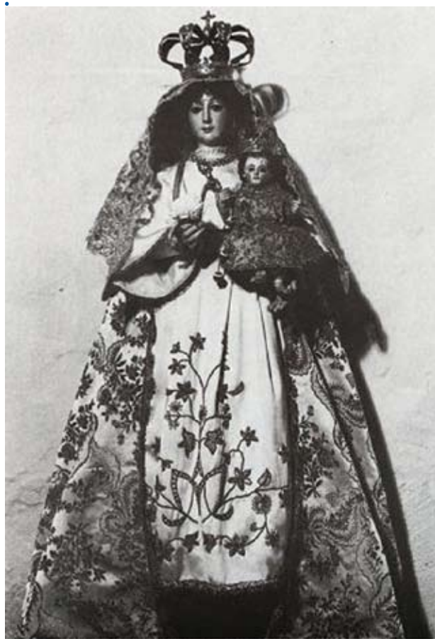
Lam. 208.-VIRGEN DE LA CABEZA. Parroquia de San Pedro y San Pablo. PUERTO MORAL (p. 430).

Cerca de esta población serrana hay datos históricos de que otrora también la Morenita tuvo culto y celebración en la población de Alajar